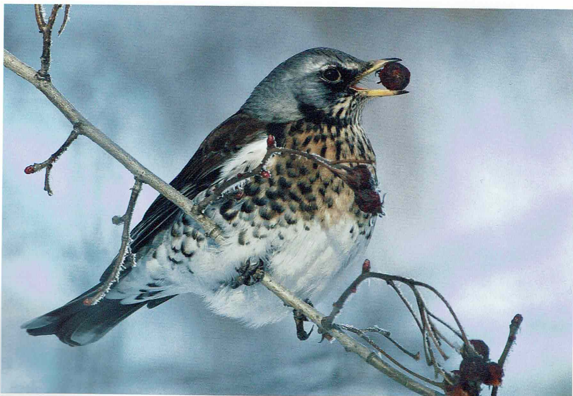
Haliaksen kaltainen rastasmuutto osuu ehkä kerran elämässä kohdalle. Se kertoo miten säätyypin äkkinäinen muutos voi saada tuhannet linnut kerrallaan liikkeelle.

Emme havainneet enempää rastaita ennen kuin pimeä laskeutui. Noin tunti auringon laskusta alkoi yötai-vaalla kuitenkin tapahtua. Vähitellen pimeydestä alkoi kuulu yhä useam-