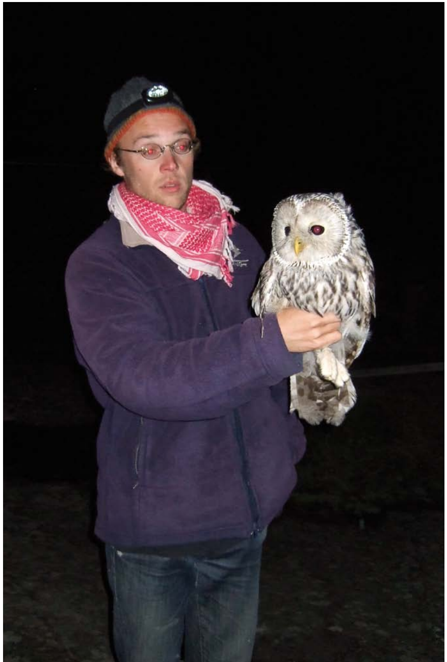
Viirupöllö Strix uralensis nuori.