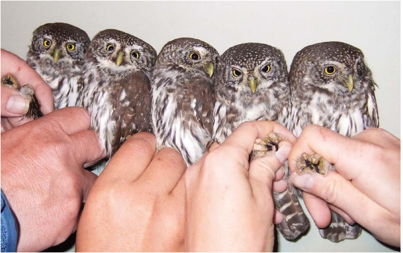
Täyskäsi varpuspöllö Glaucidium passerinum.