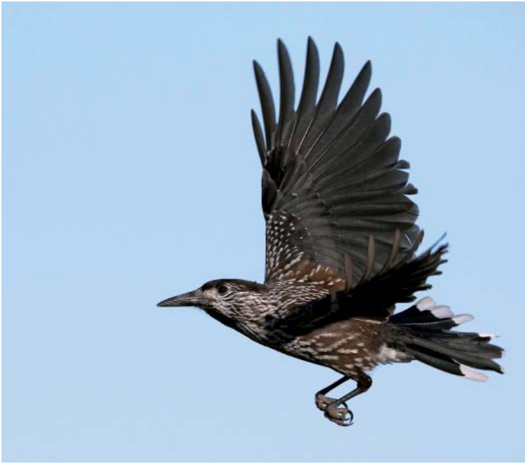
Jos tahdot nähdä Suomessa vaeltavan pähkinähakin Nucifraga caryocatactes, niin Halias on siihen paras paikka.