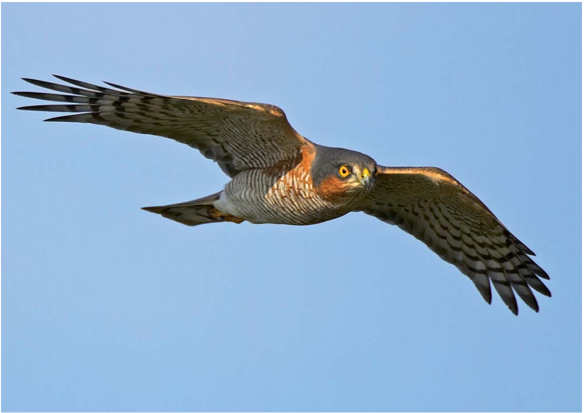
Haliaksella rengastajaparka voi joutua koville muulloinkin kuin tiaisaikana. 16.9.1994 verkoista tuli yhteensä 50 varpushaukkaa Accipiter nisus, ja muutollakin viuhto yli neljäsataa.

duimme keskeyttämään puuhan vähäksi aikaa, koska kävimme portilla ilmoittamassa Gäun särkällä palavasta veneestä! Selvisi, että vene oli ajanut yöllä karille ja siitä oli viety pariskunta + lapsi ambulanssilla terveyskeskukseen. Isällä oli ollut 1.8 promillea veressä.