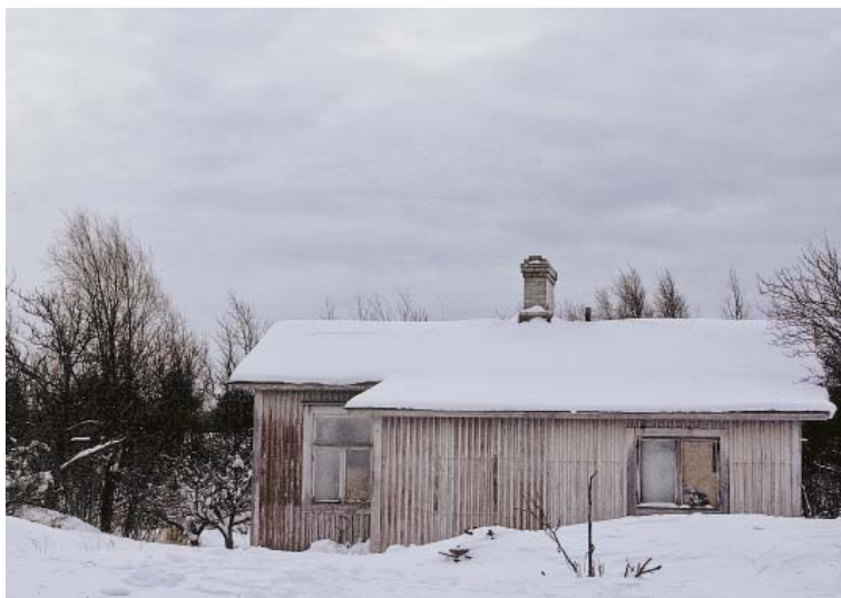
Tästä kaikki alkoi! Hangon lintuasemarakennus neitseellisessä tilassaan.

Tietoisena asemahavainnoinnin velvoitteista lähti urhea havainnoitsija kuitenkin luonnonvoimia uhaten