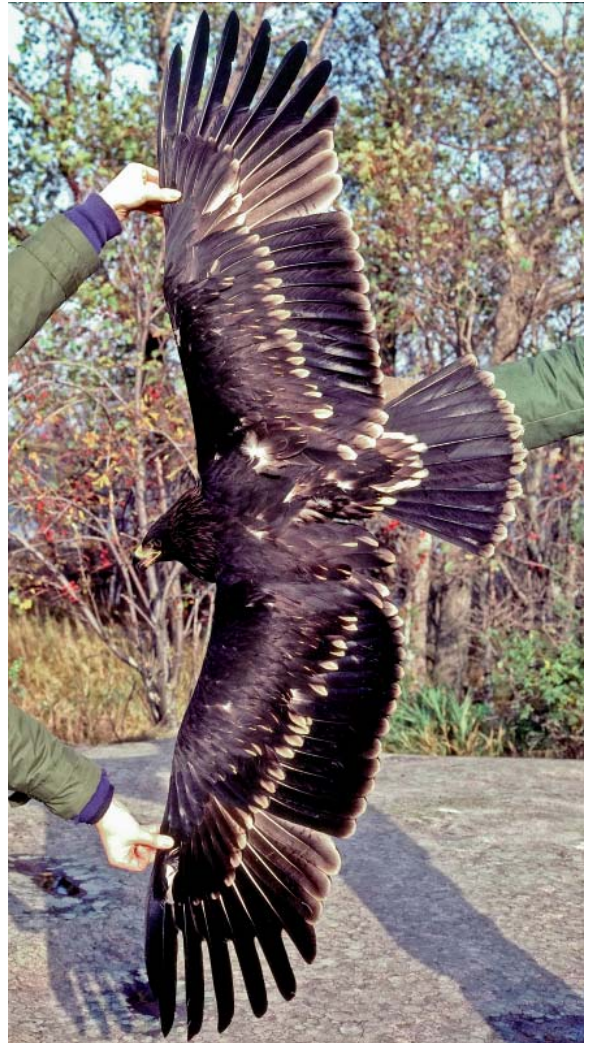
Musta kostaja eli kiljukotka Aquila clanga eksyi aseman haukkahäkkiin 19.10.1980.

taen muutaman rullan filmiä. Mainittakoon, että kameraa ei edes vaihduttu kohottamaan, mikäli näytti siltä, että alliparvi lentäisi yli 30 metrin päästä.