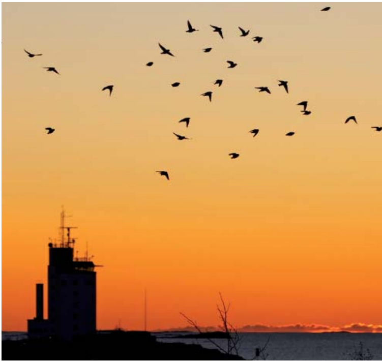
Talviauringon viime säteisissä kelpaa ihailta pihlajanmarjojen perässä vaeltavia tilhiä Bombycilla garrulus.