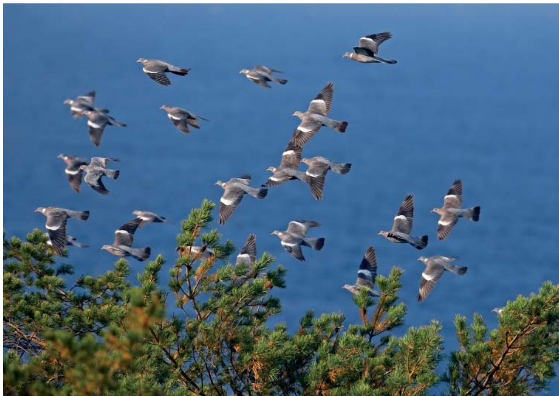
Sepelkyyhkyjen Columba palumbus muutto hivelee silmää. Löydätkö kuvasta uuttukyyhkyn Columba oenas ?

Sää oli jo inhimillesempi, jopa mukava ja onneksi on kaksi lämpömittaria, joista valita sopiva lukema! Aurinko paistoi puoleenpäivään, oli ihanaa pitkästä aikaa saada pisamia bunkkerilla. Ei siellä muuta sit tul-